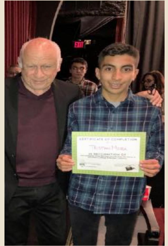
Campamento de Cine Futuro Explorado