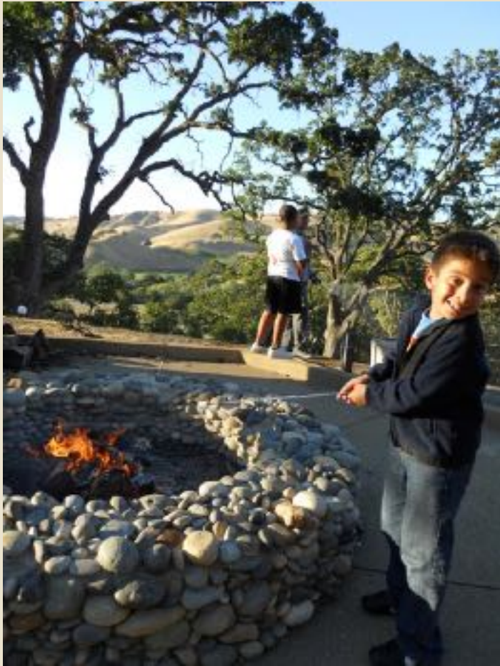
Campamento Familiar de Autismo Campamento Arroyo