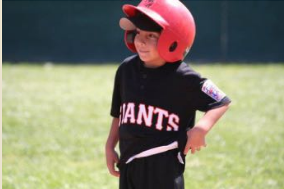
Beisbol Challenger Programa de la Ciudad de la Pequeña Liga