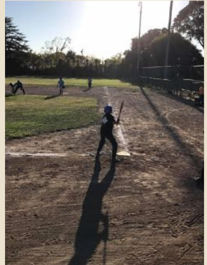
Junior Gigantes Programa de la Ciudad