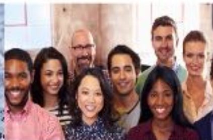
Información sobre los centros regionales