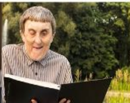
Listados de centros regionales