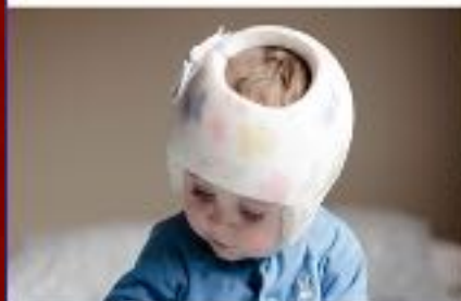
Elegibilidad y servicios del centro regional

El DDS supervisa la coordinación y prestación de servicios para los californianos con discapacidades del desarrollo a través de una red estatal de 21 agencias comunitarias sin fines de lucro conocidas como centros regionales. Los centros regionales brindan evaluaciones, determinan la elegibilidad para los servicios y ofrecen servicios de administración de casos. Los centros regionales también desarrollan, compran y coordinan los servicios en el Plan de Programa Individual de cada persona.