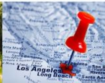
Búsqueda de centro regional